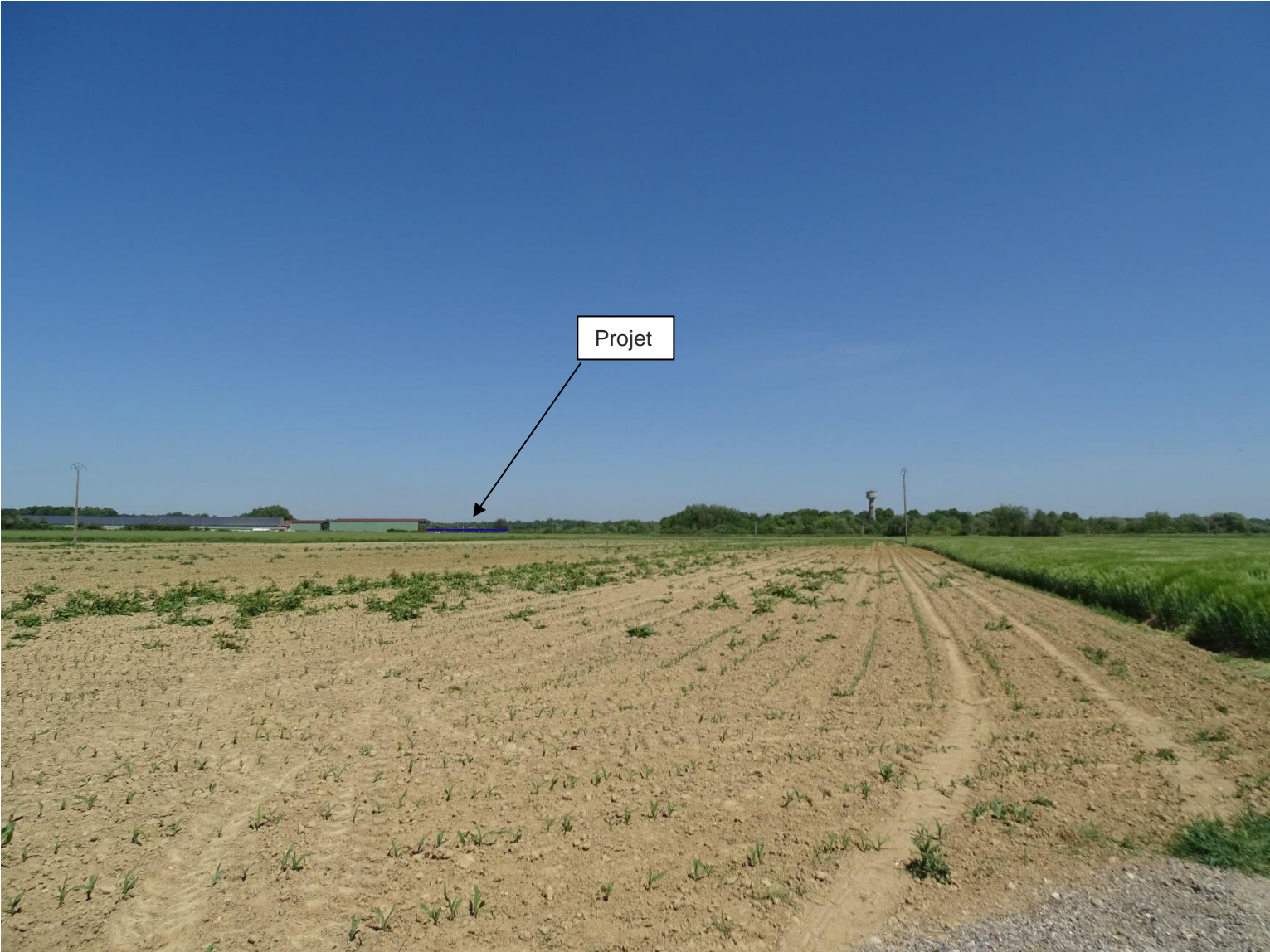
PC 6 – Vouillers – "Le Parc" – Insertion du projet de construction dans son environnement